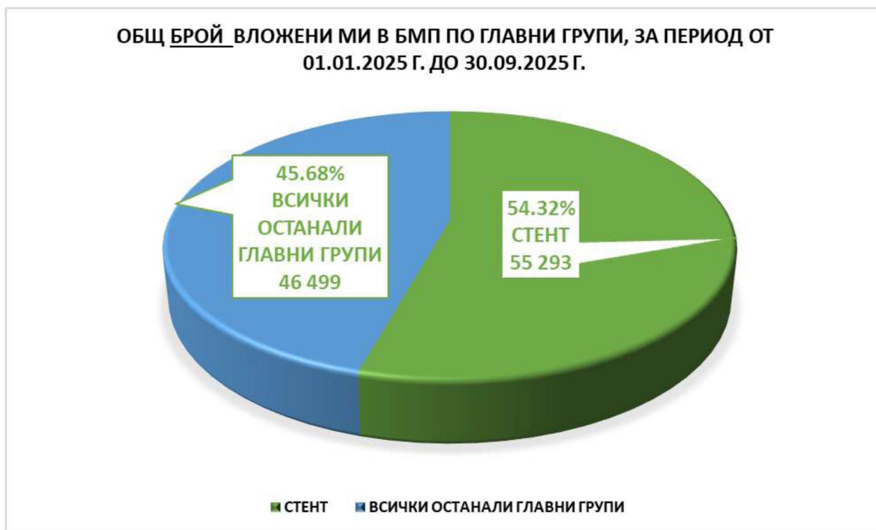
Графика № 1: Брой вложени МИ в БМП и разхода за тях (в лева )за периода януари – септември 2025 г. по главни групи.