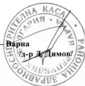
График за подписване на Индивидуалните договори за предоставяне на помощни средства, приспособления, съоръжения и медицински изделия и ремонтни дейности, заплащани от НЗОК